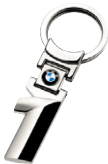
キーリング BMW 1 Series [8027 2287 777] ¥3,456 (¥3,200)

駆け抜ける夢を集めてみませんか。 BMWライフスタイルが実現するコレクターズ・ワールド。