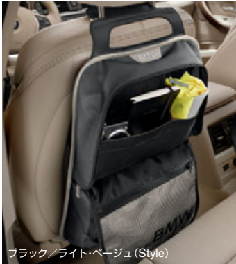
ブラック/ライト・ベージュ (Style)