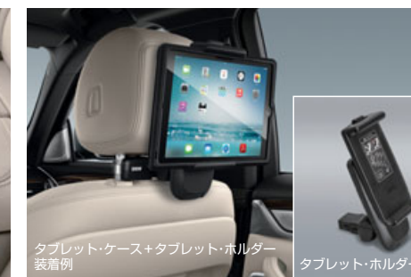
タブレット・ホルダー [5195 2408 224] ¥18,036 (¥16,700) 上記のタブレット・ケースを装着したタブレットをホルダーにはめて車内で使用します。 様々なタブレットに合わせてサイズを設定できます。 簡単に脱着できるため、タブレットの持ち運びに便利です。 360度回転式、向きや傾斜角度の調節が可能です。 ※車両に装着してご使用になる場合は、別売の左記タブレット・ケースをご購入ください。 ※タブレット・ケースを取り付けられない場合は、使用しないでください。 ※写真のベース車両は1シリーズとは異なります。