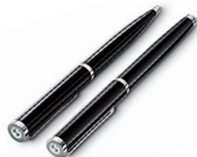
BMW ライティング・セット [8024 2217 298] ¥20,844 (¥19,300)

サイズ(mm)：12×30×5 BMWロゴが埋め込まれた小さなUSB・メモリー・スティック。 美しくデザインされたマットなシルバー・メタル・ケース。