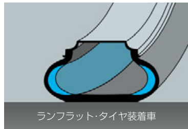
ランフラット・タイヤ装着車