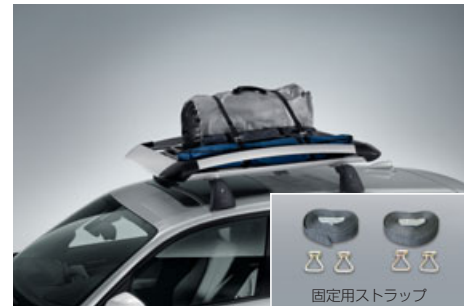
固定用ストラップ