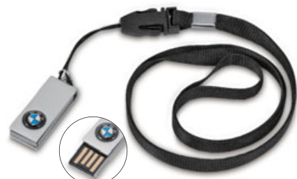
USB メモリー メタルケース型 16GB [8029 2358 820] ¥4,212 (¥3,900) 32GB [8029 2411 124] ¥4,428 (¥4,100)

サイズ(cm)：約15(ラバー部分) 簡単に鍵を束ねられる、スクリュー・タイプのキャップ付。 ドイツ製。