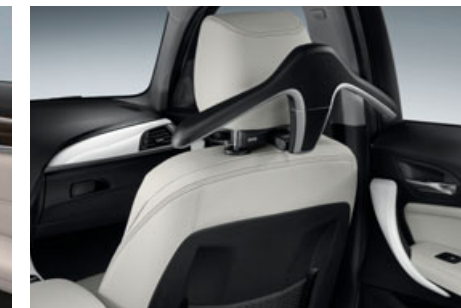
コート・ハンガー [5195 2449 251] ¥10,908 (¥10,100) 折り目をつけることなく衣類を掛けることができます。 ハンガー部分は取り外し可能で、衣類をハンガーに掛けたまま車外へ持ち運ぶことも可能です。