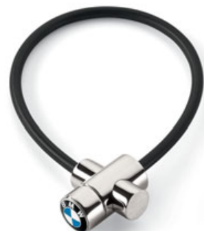
BMW キー・リング ラバー・ループ [8027 2411 125] ¥3,348 (¥3,100)

ブラック・レザーとBMWワードマーク入りの 艶消しステンレス製キー・ホルダー。 上質なスプリット・リング付。 サイズ(mm)：全長/約115、リング外径/30、リング幅/3