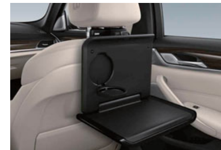
ホールディング・テーブル [5195 2449 252] ¥16,524 (¥15,300) 後部座席の同乗者が物を置くの便利なスペースとなり、傾きや高さは調節可能です。 折り畳み式カップ・ホルダーも付いています。 ※ 使用しない場合は、折り畳んでください。 ※写真のベース車両は1シリーズとは異なります。

トラベル&コンフォート・システムのベース・キャリアに、それぞれのアイテムを差し込み取り付けます。