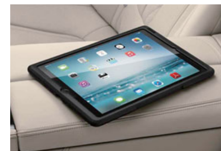
タブレット・ケース 各 ¥6,804 (¥6,300) [5195 2420 906] iPad Air 2用 [5195 2446 882] iPad Pro 9.7インチ用 [5195 2420 907] GALAXY Tab S2用 [5195 2449 295] GALAXY Tab A 9.7インチ用 ¥6,048 (¥5,600) [5195 2420 910] iPad mini 4用 エア・クッションの役割をするシリコン100%のカバーとディスプレイ保護フィルムが、タブレットを二重に保護します。 BMWのワードマーク入り。 ※車両に装着してご使用になる場合は、別売のタブレット・ホルダー [5195 2408 224] をご購入ください。 ※写真のベース車両は1シリーズとは異なります。 ※iPadは、米国および他の国々で登録されたApple Inc.の商標です。