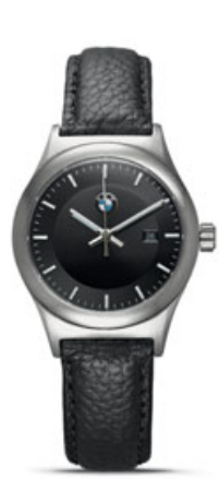
クラシック・ウォッチ 各 ¥21,600 (¥20,000)

ドイツ製の万年筆とボールペンのセット。 人間工学に基づいた手になじむ構造です。 キャップ上とクリップ部分にBMWロゴ入り。 2年間の保証書付。 クロム/ブラック