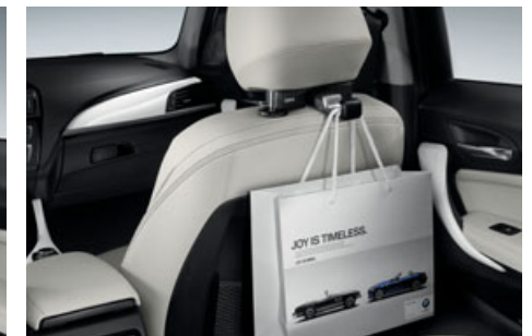
ユニバーサル・フック [5195 2183 855] ¥4,709 (¥4,360) 軽量のショッピング・バッグやハンガー等を掛けるのに便利です。