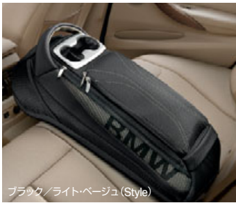
ブラック/ライト・ベージュ (Style)