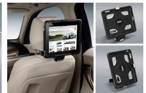
タブレット・ホルダー (ケース/ホルダー一体型) ¥30,240 (¥28,000) [5195 2360 373] iPad 第2,3,4世代用 各 ¥23,652 (¥21,900) [5195 2186 297] iPad 第1世代用 [5195 2285 316] GALAXY Tab 3,4用 ¥20,412 (¥18,900) [5195 2349 511] iPad mini 1,2,3用 タブレット・ケース一体型のホルダーです(タブレット・ケースとホルダーは固定式で外れません)。ディスプレイ保護フィルム付。 360度回転式、向きや傾斜角度の調節が可能です。 付属のラバー・スタンドを取り付けていただくことで、車外でもご使用いただけます(写真 右側)。