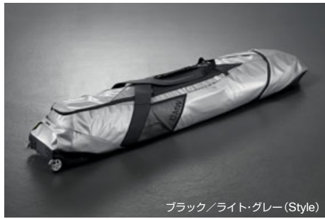
ブラック/ライト・グレー (Style)

最大スキー4組またはスノーボード3枚まで収納でき、ラゲージ・ルーム内のフロント側アンカーに接続してしっかりと固定します。 取り外しも簡単で、バッグには2つのキャスターが付いているので、車外での持ち運びに便利です。 BMWのワードマーク入り。