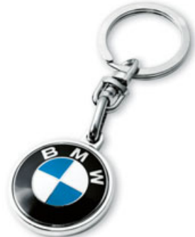
BMW ロゴ・キー・リング [8023 0444 663] ¥3,953 (¥3,660)

素材：亜鉛ダイキャスト フレキシブルなダブル・ジョイント。 1シリーズのナンバーを埋め込んだ デザイン・モチーフのキー・リング。