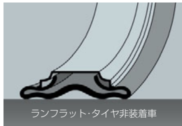
ランフラット・タイヤ非装着車