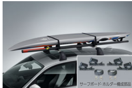
サーフボード・ホルダー構成部品