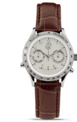
BMW ウォッチ・デイデイト

レディース [8026 2406 686] ¥27,864 (¥25,800) メンズ [8026 2406 689] ¥30,564 (¥28,300) ケース直径：約35mm ブラウン・レザー 交換用ストラップ(ブラウン) [8026 2409 200] ¥5,076 (¥4,700) 最大幅 約18mm、長さ 115 / 75 mm